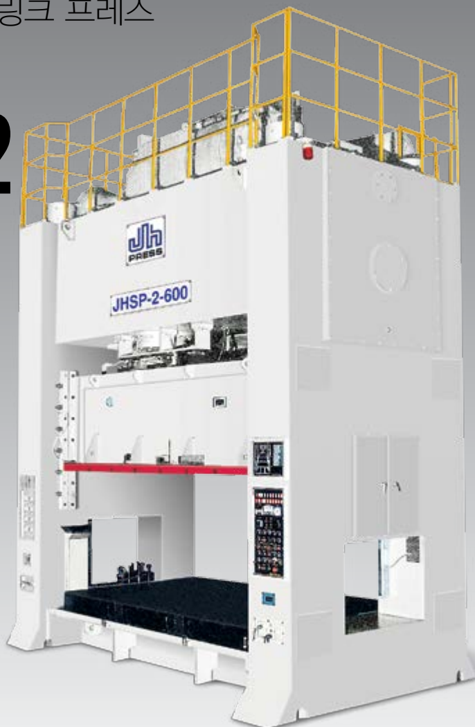
H TYPE STRAIGHT SIDE SINGLE CRANK PRESS / LINK PRESS (사양별도)